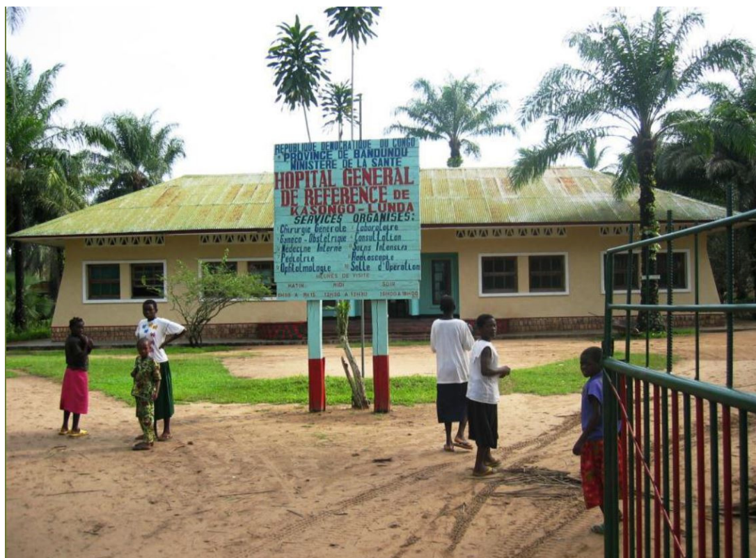
De ingang van het ziekenhuis